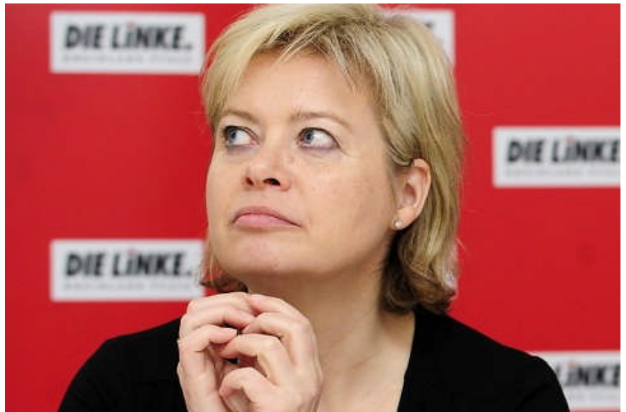
Die Linkspartei-Vorsitzende Gesine Lötzsch fehlte bei der Debatte im Deutschen Bundestag und verweigerte sich der Diskussion über ihre umstrittenen Kommunismus-Äußerungen.