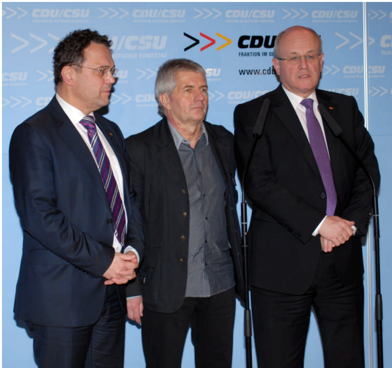
Am 28. Januar 2011 wurde der Bürgerrechtler und Journalist Roland Jahn (Mitte) zum neuen Bundesbeauftragten für die Unterlagen des Staatssicherheitsdienstes der ehemaligen DDR gewählt. Zuvor hatte er den Mitgliedern der Unionsfraktion – hier CSU-Landesgruppenvorsitzender Hans-Peter Friedrich (l) und Fraktionsvorsitzender Volker Kauder – einen Besuch abgestattet.

Noch bevor der Deutsche Bundestag im Januar Roland Jahn zum neuen Bundesbeauftragten für die Unterlagen der DDR-Staatssicherheit gewählt hat, dankte Bundestagspräsident Norbert Lammert (CDU) in einer kurzen Ansprache der bisherigen Bundesbeauftragten Marianne Birthler, die mit ihrem Vorgänger Joachim Gauck auf der Tribüne saß, für ihre zehnjährige Arbeit. Die Abgeordneten erhoben sich von ihren Plätzen und applaudierten minutenlang. Nur die Mitglieder der Linkspartei blieben trotzig sitzen, bei Ihnen rührte sich keine Hand.