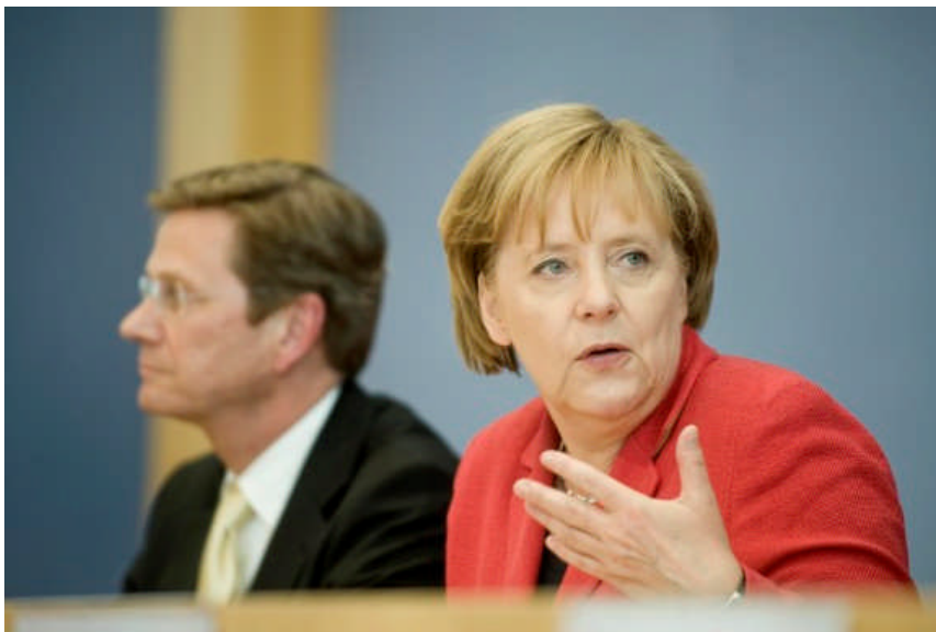
Bundeskanzlerin Angela Merkel und Vize-Kanzler Guido Westerwelle erläutern nach Ende der Kabinettsklausur das ambitionierte Sparpaket der Bundesregierung.

Die Konsolidierung des Bundeshaushaltes ist zwingend notwendig, um die Rahmenbedingungen für das Entstehen neuer Arbeitsplätze zu verbessern, den Wohlstand unseres Landes auf Dauer zu sichern und unseren Kindern und Enkelkindern keine untragbare Schuldenlast aufzubürden. Zur Wahrheit gehört, dass die jeweiligen Bundesregierungen in den zurückliegenden 40 Jahren stets mehr Geld ausgegeben haben, als sie durch Steuern eingenommen haben. Und das oft auch in wirtschaftlich guten Zeiten und zulasten der nächsten Generationen. Das kann und darf so nicht mehr länger weitergehen! Schon in meiner Zeit als Neumarkter Oberbürgermeister lautete mein Credo: Wir können nur so viel ausgeben, wie wir einnehmen.