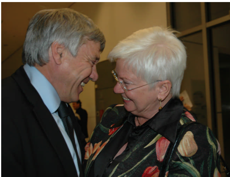
MdB Alois Karl gratuliert Gerda Hasselfeldt zu ihrer Wahl an die Spitze der einflussreichen CSU-Landesgruppe im Deutschen Bundestag.

wurde sie zur Vizepräsidentin des Deutschen Bundestages gewählt – dieses Amt gibt sie nun zugunsten des Landesgruppenvorsitzes ab. Ich wünsche ihr für ihre neue und nicht immer einfache Aufgabe viel Erfolg!