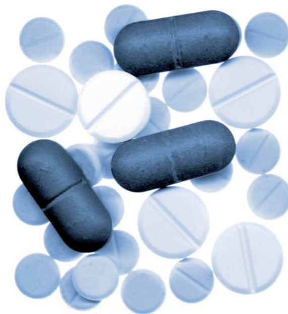
Unser ambitioniertes Arzneimittel-Sparpaket wird um ein halbes Jahr vorgezogen auf den 1. August 2010.