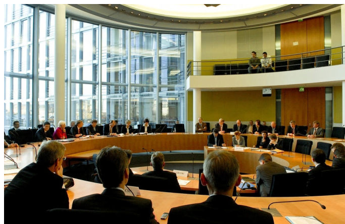
Der Deutsche Bundestag (l.) muss allen Anträgen auf Stützungsmaßnahmen, Änderungen sowie Anpassungen am Rettungsschirm zustimmen. Für eilige oder vertrauliche Fälle wird ein eigens Gremium aus Mitgliedern des Haushaltsausschusses (r.) eingerichtet.

Für Ausnahmefälle sollen auch Aufkäufe von Staatstiteln am Primär- und Sekundärmarkt durch den Rettungsschirm möglich sein. Damit kann übermäßiger Preisdruck an den Märkten abgeschwächt werden. Auch können so Finanzinvestoren an Kursverlusten unmittelbar beteiligt werden. Vor allem aber entlasten wir damit die Europäische Zentralbank, die bislang allein Staatstitel am Sekundärmarkt aufkauft, um Preisverzerrungen zu vermeiden und die Währungsunion vor Spekulation zu schützen. Mit all diesen Maßnahmen geht es um den Schutz unserer Wirtschaft und unserer Währung.