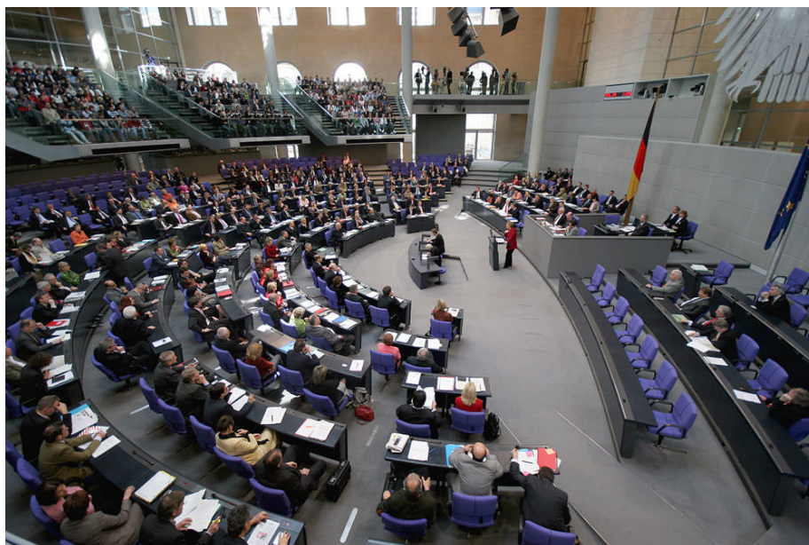
Der Deutsche Bundestag hat in der vergangenen Woche das deutsche Paket für den Euro-Rettungsschirm beraten und beschlossen.

Der Druck auf den Euro, Nachrichten über europäische Staaten vor dem Staatsbankrott, die Vielstimmigkeit der Experten und der Eindruck einer gewissen Hilflosigkeit der Politik gegenüber den Märkten haben bei vielen Menschen zu Verunsicherung, Angst um das Ersparte und Skepsis gegenüber dem Euro geführt.