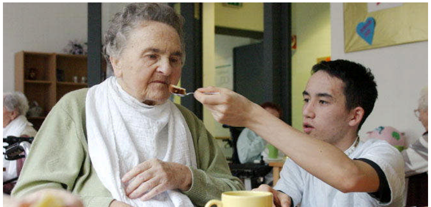
Einsatz für die Allgemeinheit: Der neue Bundesfreiwilligendienst (BFD) bietet verschiedene Möglichkeiten, sich zu engagieren und wertvolle Erfahrungen zu sammeln.

Am 1. Juli 2011 startet der Bundesfreiwilligendienst (BFD). Damit haben wir ein Angebot für alle Bürgerinnen und Bürger geschaffen, die unser Gemeinwesen mitgestalten und sich engagieren möchten. Auch die Freiwilligendienste in Deutschland werden gestärkt. Ziel ist es, möglichst vielen Menschen einen Einsatz für die Allgemeinheit und die positive Erfahrung von bürgerschaftlichem Engagement zu ermöglichen. Der BFD bietet – wie seitdem der Zivildienst – für Frauen und Männer jeden Alters die Gelegenheit, wichtige persönliche und soziale Kompetenzen und Erfahrungen zu sammeln oder zu vertiefen.