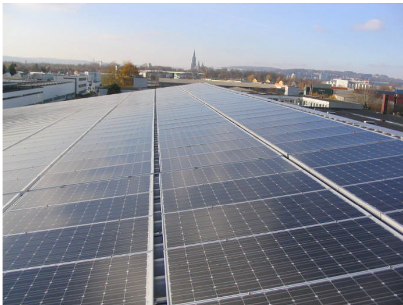
Enorme Preissenkungen auf den Märkten haben gezeigt, dass die Photovoltaik schneller als gedacht eine immer wichtigere Rolle in unserem Energiemix spielen kann. Niedrigere Vergütungssätze bedeuten eine geringere EEG-Umlage. Das entlastet den Strompreis.

Die Solarstromgewinnung wird auch aber weiterhin ein lohnendes Geschäft bleiben. Denn die Kosten für PV-Anlagen sind allein im zurückliegenden Jahr 2009 massiv, nämlich um rund 30 Prozent gesunken. Erwartungen von zweistelligen Renditen können meiner Meinung nach nicht die Basis für eine zeitlich unbegrenzte staatliche Festlegung der garantierten Einspeisevergütungen sein.